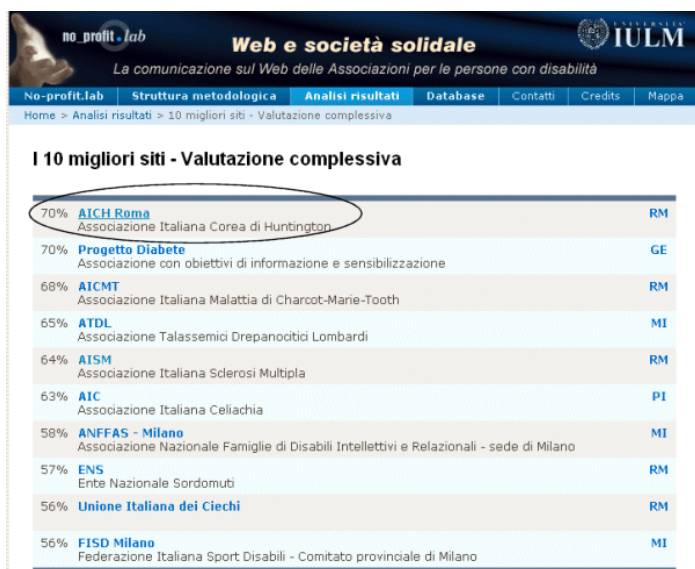
(Fig.3 I 10 migliori siti recensiti dalla ricerca della IULM)

Il nostro sito è stato valutato il migliore sulla base di indici per la valutazione qualitativa quali: l'usabilità, l'accessibilità, l'orientamento al tema, i servizi on-line, la community e la diffusione di buone prassi.