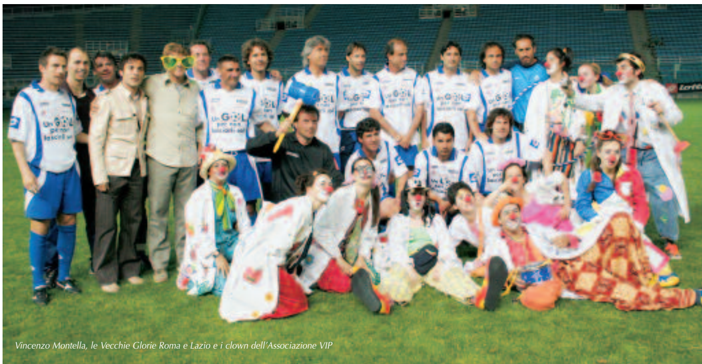
Vincenzo Montella, le Vecchie Glorie Roma e Lazio e i clown dell'Associazione VIP

coinvolto partecipanti e spettatori in un unico grande abbraccio virtuale.